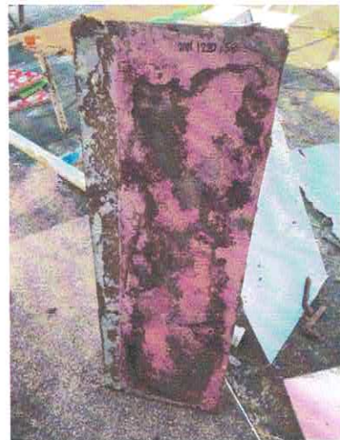
วกศ. ๑๒๒๐/๕๘