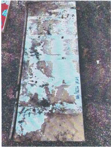
วกศ. ๑๒๒๘/๕๘