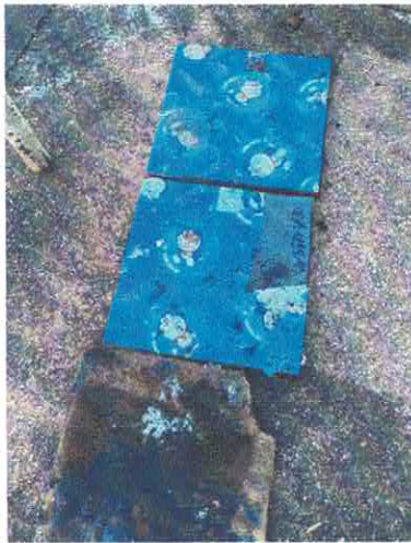
วกศ. ๑๒๒๕/๕๘