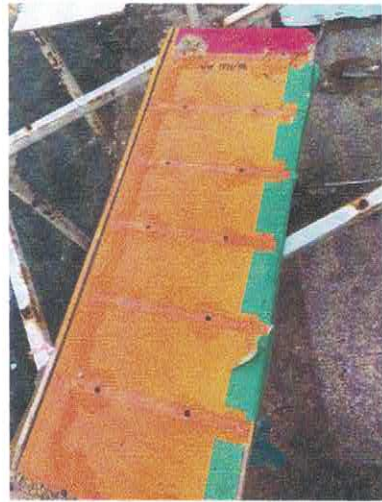
วกศ. ๑๒๒๑/๕๘