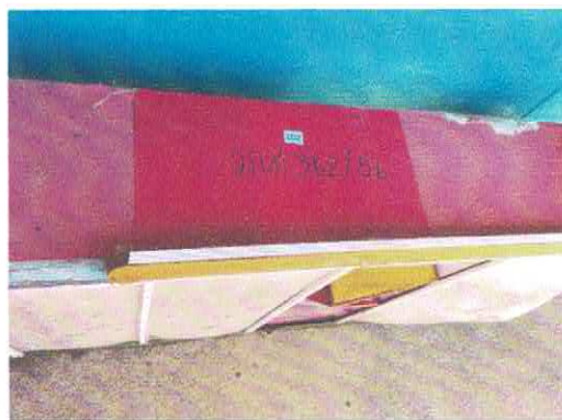
๓๖๒/๕๖ (๑๐๒)